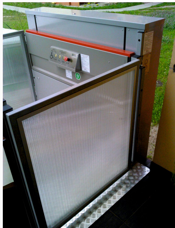
Podnośnik pionowy B900 - wersja przelo