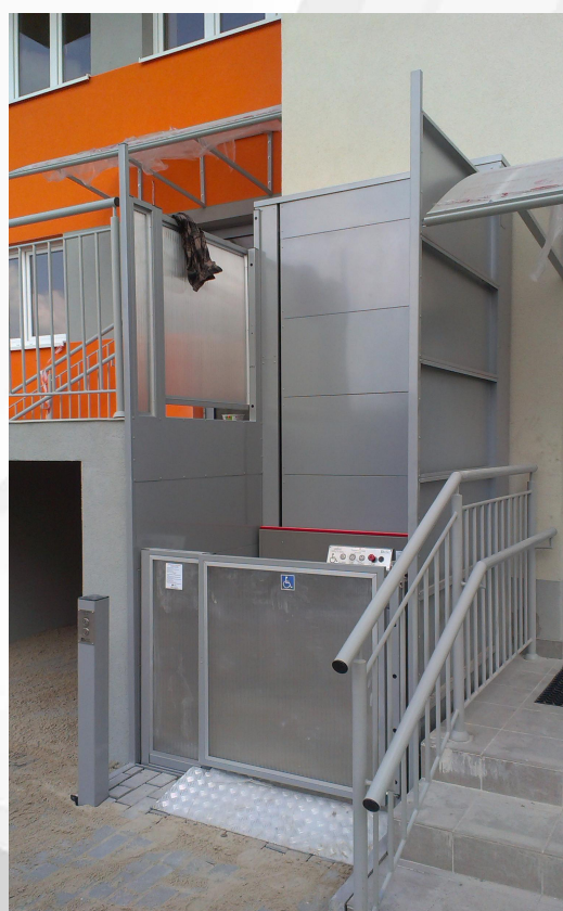
Podnośnik pionowy B900 - wersja k